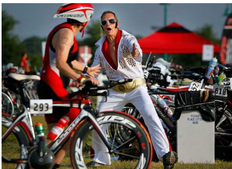
Arrivederci al prossimo numero!